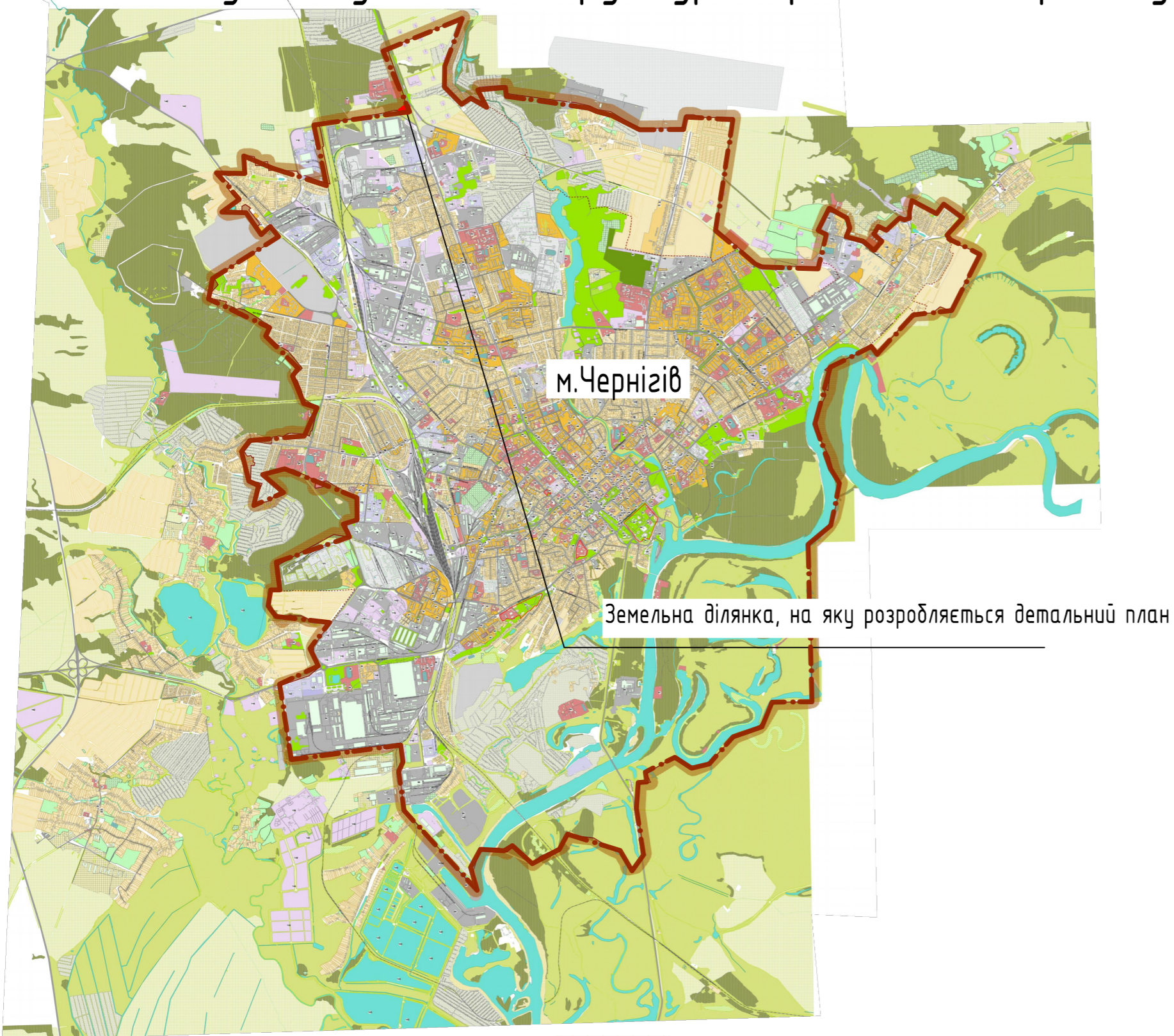
Схема розташування земельної ділянки у планувальній структурі Чернігівського району